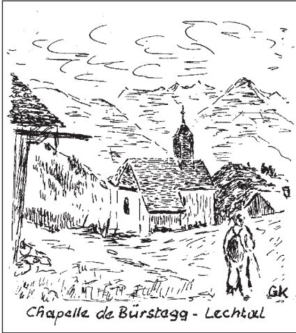
Chapelle de Bürstegg - Lechtal