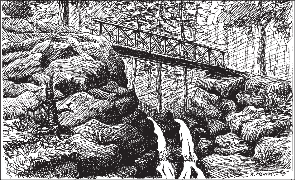
Dessin de Roger Mercky qui avait illustré la couverture du numéro 79 de notre bulletin «Contact»

● ● ● Comme on peut lire en page 8 du compte-rendu d'activités, la passerelle de la Serva, fermée pour des raisons de sécurité il y a 2 ans, vient d'être totalement démontée.